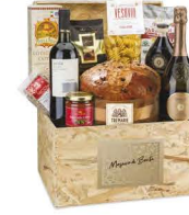
C3.GDS.629 Mosaico di Bontà - pezzi 11 - pag. 32

*Esclusivo Cofanetto in Legno *Vino Spumante Brut 75 cl Casa Coller *Vino Rosso Veneto IGT Merlot 75 cl Le Morre *Il Panettone Milanese 750 g Tre Marie *Noccioghiotti al Cioccolato 75 g Dulcoliva *Pasta Artigianale i Fusilli 250 g e Le Gemme del Vesuvio *Sugo alle Olive 180 g Villa Reale *Tarallini Pomodoro e Origano 100 g Terre di Puglia *Aceto Balsamico di Modena IGP 25 cl Due Vittorie *Lenticchie Chicchi della Fortuna 250 g Melandri *Cotechino Cotto 250 g Salumificio Vecchi