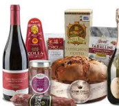
C3.GDF.622 Fresco d'Autore - pezzi 9 - pag. 38

*Shopper Luxury *Vino Spumante Brut 75 cl Casa Coller *Vino Rosso Barbera dell'Oltrepò Pavese DOC 75 cl Az. Agr. Terre Bentivoglio *Il Panettone Classico 750 g Giovanni Cova & C. *Cipollette Borettane 280 g AdArte *Tarallini Pomodoro e Origano 100 g Terre di Puglia *Lenticchie Chicchi della Fortuna 250 g Melandri *Cotechino Cotto 250 g Salumificio Vecchi *Grana Padano DOP Stagionatura Minima 16 Mesi 150 g circa Colla *Salame del Contadino 200 g circa Monte San Savino