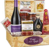
C3.GDF.450 Viaggi del Gusto - pezzi 11 - pag. 34

*Esclusiva Cassetta in Legno *Vino Rosso Bonarda dell'Oltrepò Pavese DOC 75 cl Az. Agr. Terre Bentivoglio *Peperoni in Aceto di Mele 300 g Tenuta Casa Ortolami *Pomodori Secchi 280 g Tenuta Casa Ortolami *Tarallini Pomodoro e Origano 100 g Terre di Puglia *Aceto Balsamico di Modena IGP 25 cl Due Vittorie *Lenticchie Chicchi della Fortuna 250 g Melandri *Cotechino Cotto 250 g Salumificio Vecchi *Grana Padano DOP Stagionatura Minima 16 Mesi 150 g circa Colla *Lardo in Conca di Marmo "Il Bianco" 250 g circa Larderla La Repubblica *Salame Chianotto 200 g circa Norcheria Toscana