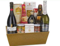
C3.GDF.729 Bontà e Tradizione - pezzi 12 - pag. 30

*Confezione Regalo *Vino Spumante Cuvée Brut 75 cl Duchessa Lia *Vino Rosso Lambrusco Salamino di Santa Croce DOC Secco 75 cl Chiari *Pasta di Semola di Grano Duro - La Gramigna 500 g Tenuta Cuniola *Verdure al Pinocchio in Aceto di Mele 300 g Tenuta Casa Ortolami *Sughetto Basilico e Olive 180 g Tenuta Casa Ortolami *Aceto Balsamico di Modena IGP 25 cl Due Vittorie *Lenticchie Chicchi della Fortuna 250 g Melandri *Cotechino Cotto 250 g Salumificio Vecchi *Parmigiano Reggiano DOP Stagionatura Oltre 22 Mesi 150 g circa Colla *Grana Padano DOP Stagionatura Minima 16 Mesi 150 g circa Colla *Crema di Lardo alle Erbe 90 g circa Larderla La Repubblica