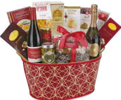
C3.GDS.689 Saperi e Delizie - pezzi 14 - pag. 22

*Masi Fioriera Decoro Esclusivo con Manici *Vino Spumante Brut 75 cl Casa Coller *Vino Rosso Barbera dell'Oltrepò Pavese DOC 75 cl Az. Agr. Terre Bentivoglio *Il Panettone Classico 750 g Borsari *Canestrelli 80 g Virginia *Cantuccini al Cioccolato 80 g Belli *Cioccolato al Latte con Tonnarelli 100 g Montevergine *Praline di Cioccolato Fondente 105 g Montevergine *Pasta Artigianale i Fusilli 250 g e Le Gemme del Vesuvio *Sugo alle Olive 180 g Villa Reale *Olive Bella di Carignola 280 g AdArte *Focaccine con Rosmarino 100 g Bonità Lucane *Lenticchie Chicchi della Fortuna 250 g Melandri *Cotechino Cotto 250 g Salumificio Vecchi