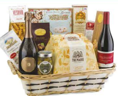
C3.GDS.737 Gardenia - pezzi 12 - pag. 26

*Cesto in vimini con Manici *Vino Spumante Brut 75 cl Casa Coller *Vino Rosso Barbera dell'Oltrepò Pavese DOC 75 cl Az. Agr. Terre Bentivoglio *Il Panettone Milanese 750 g Tre Marie *Canestrelli Classici 150 g Virginia *Praline di Cioccolato Fondente 105 g Montevergine *Torrone Morbido Nocciola e Mandorla 90 g Montevergine *Pasta Artigianale i Fusilli 250 g e Le Gemme del Vesuvio *Olive Bella di Carignola 280 g AdArte *Funghi Secchi Premium 15 g L'Orto della Montagna *Lenticchie Chicchi della Fortuna 250 g Melandri *Cotechino Cotto 250 g Salumificio Vecchi