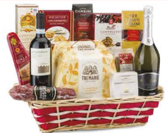
C3.GDF.438 Sagittario - pezzi 13 - pag. 24

*Cesto in vimini con Manici *Vino Spumante Cuvée Brut 75 cl Duchessa Lia *Vino Rosso Montepulciano d'Abruzzo DOC 75 cl Le Morre *Il Panettone Milanese 750 g Tre Marie *Cantuccini al Cioccolato 80 g Belli *Cioccolato Extra Fondente 75 g Baratti & Milano *Focaccine con Rosmarino 100 g Bonità Lucane *Caffè Aromatico e Corposo 100 g Corsini *Lenticchie Chicchi della Fortuna 250 g Melandri *Cotechino Cotto 250 g Salumificio Vecchi *Grana Padano DOP Stagionatura Minima 16 Mesi 150 g circa Colla *Crema di Lardo alle Erbe 90 g circa Larderla La Repubblica *Salame del Contadino 200 g circa Monte San Savino