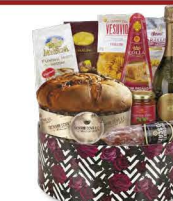
C3.GDF.708 Cappelliera di Natale - pezzi 10 - pag. 36

*Esclusiva Cappelliera Regalo con Fiocco *Vino Spumante Brut 75 cl Casa Coller *Il Panettone Classico 750 g Giovanni Cova & C. *Praline di Cioccolato Fondente 105 g Montevergine *Pasta Artigianale i Fusilli 250 g e Le Gemme del Vesuvio *Sugo alle Olive 180 g Villa Reale *Tarallini Pomodoro e Origano 100 g Terre di Puglia *Funghi Secchi Premium 15 g L'Orto della Montagna *Grana Padano DOP Stagionatura Minima 16 Mesi 150 g circa Colla *Salame del Contadino 200 g circa Monte San Savino