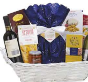
C3.GDS.739 Dalia - pezzi 10 - pag. 40

*Cesto in vimini con Manici *Vino Spumante Cuvée Brut 75 cl Duchessa Lia *Vino Rosso Veneto IGT Merlot 75 cl Le Morre *Il Pandoro Ricetta di Pasticceria 750 g Maina *Cantuccini al Cioccolato 80 g Belli *Cioccolato al Latte 75 g Baratti & Milano *Praline di Cioccolato Fondente 105 g Montevergine *Pasta Artigianale i Fusilli 250 g e Le Gemme del Vesuvio *Sughetto Basilico e Olive 180 g Tenuta Casa Ortolami *Focaccine con Rosmarino 100 g Bonità Lucane