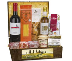
C3.GDF.709 Delizie di Toscana - pezzi 9 - pag. 28

*Esclusiva Cassetta in Legno *Vino Liquoroso Sancte 16% vol 37,5 cl Buccarelli *Vino Rosso Toscana IGT Pogio Galiga 75 cl F.lli Grati *Cantuccini alle Mandorle 150 g Belli *Bucatini Pasta di Semola di Grano Durro Trafilata al Bronzo 500 g Michele Portoghese *Sugo all' Amatriciana con Guanciale da Citta Senese DOP 180 g i Toscanacci *Caffè Aromatico e Corposo 100 g Corsini *Lardo in Conca di Marmo "Il Bianco" 250 g circa Larderla La Repubblica *Salame Toscano 300 g circa Monte San Savino